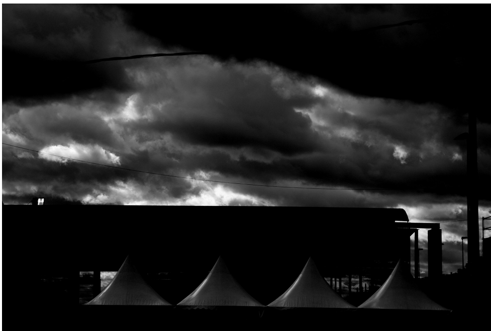
Figura 2. Fotografía de la Estación de Córdoba.