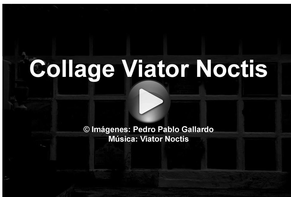
Figura 3. Enlace al Vídeo en You Tube titulado “Collage Viator Noctis”. Clic sobre la imagen.

• Este vídeo muestra algunos momentos de siete de los proyectos artísticos de Viator Noctis titulado “Collage Viator Noctis”. Para ello, y con la intención de crear un collage sonoro, se han seleccionado las partes musicales que nos han parecido más interesantes de cada una de las canciones, y se han utilizado algunas de las imágenes que formaban parte del Libreto Cementerio de Mentas Vivas, donde se recogían de forma teórica las distintas propuestas artísticas (2).