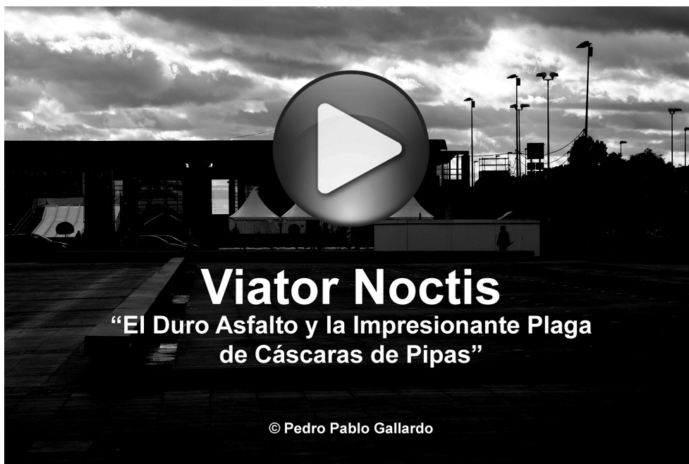
Figura 1. Enlace al Vídeo en You Tube sobre la canción “El Duro Asfalto y la Impresionante Plaga de Cáscaras de Pipas”. Clic sobre la imagen.

• Este vídeo muestra algunos momentos sobre el proyecto artístico de Viator Noctis titulado “El Duro Asfalto y la Impresionante Plaga de Cáscaras de Pipas”. Un viaje desde la Estación de Córdoba, para reflexionar sobre los problemas medio ambientales y de basura en la ciudad.