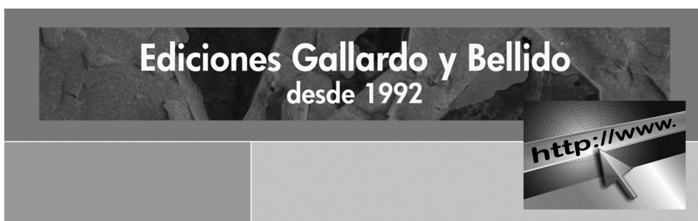
Figura 4. Enlace a la web Ediciones Gallardo y Bellido. Clic sobre la imagen.

Y por último, se muestra una selección de fotografías sobre la Estación de Córdoba, utilizadas para la elaboración del vídeo titulado “El Duro Asfalto y la Impresionante Plaga de Cáscaras de Pipas”, realizadas por Pedro Pablo Gallardo.